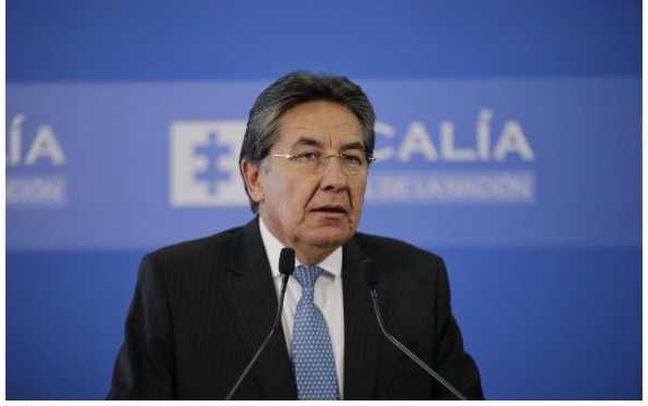
Néstor Humberto Martínez, fiscal general de la nación.

COLOMBIA CONSEJO SUPERIOR DE LA JUDICATURA FISCALÍA GENERAL DE LA NACIÓN JUSTICIA NÉSTOR HUMBERTO MARTÍNEZ REFICAR