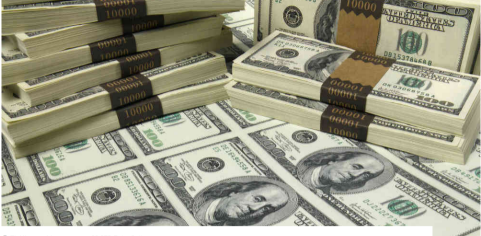
El dólar cerró la semana en $3.272

El peso colombiano se devaluó esta semana 1,1% en medio de una mayor aversión al riesgo asociado a las mayores tensiones comerciales entre Estados Unidos y China. La próxima semana se conocerá el dato del PIB del primer trimestre de Colombia el cual estaría alrededor del 3%.