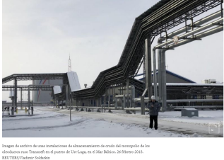
Imagen de archivo de unas instalaciones de almacenamiento de crudo del monopolio de los oligopolios ruso Transoil en el puerto de Ust-Luga, en el Mar Báltico. 26 febrero 2018.

LONDRES, 10 mayo (Reuters) - Los precios del crudo subían el viernes, incluso a pesar de que la entrada en vigor del alza arancelaria sobre bienes chinos por valor de 200.000 millones de dólares por parte de Estados Unidos mantenía la tensión alta en la disputa comercial entre las dos mayores economías mundiales.