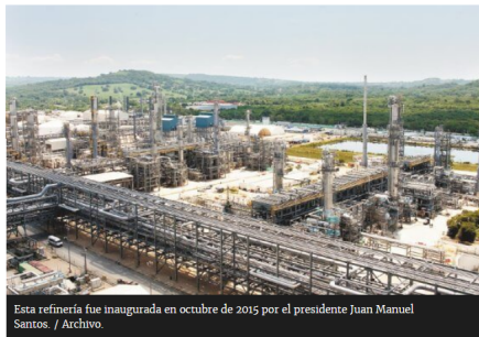
Esta refinería fue inaugurada en octubre de 2015 por el presidente Juan Manuel Santos.

Según Néstor Humberto Martínez, las recurrentes maniobras para dilatar las audiencias por parte de la defensa tienen a este proceso "en camino a la prescripción".