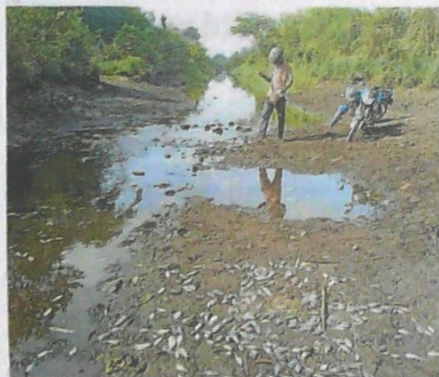
Peces muertos por la sequía en los canales del Distrito de Riego, un aspecto de los trabajos y bajos niveles en el embalse.

aparece la rehabilitación de 45,5 hectáreas en el Cerro de La Popa, entre otros.