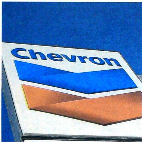
La acción de Chevron subió ayer 3,14% en la bolsa de N. Y.