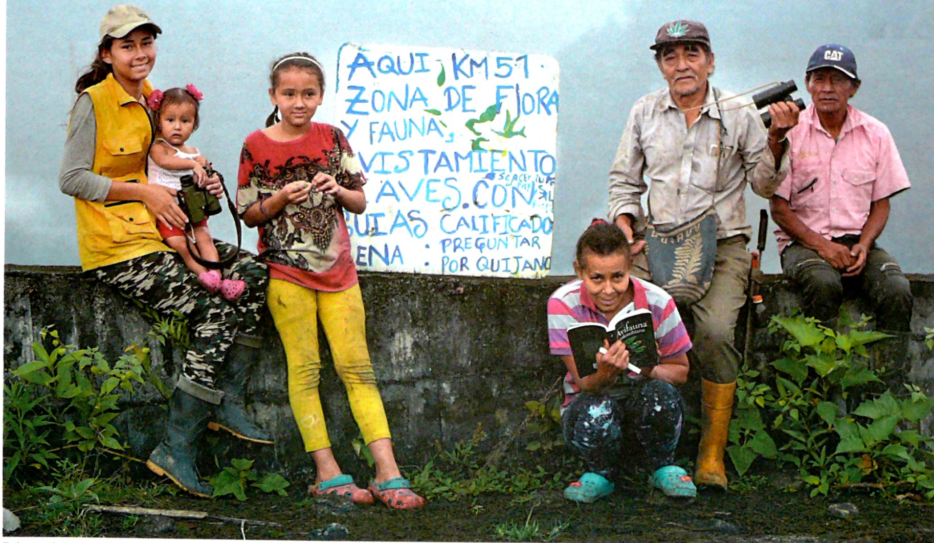
En la vereda Buenos Aires, en Santa Rosa, Cauca, los niños y los adultos mayores también salen a "pajarear".

La comunidad de Santa Rosa (Cauca) pasó de víctima del conflicto armado en Colombia a ganadora del famoso concurso internacional de documentación de aves Global Big Day. El humilde municipio del sur del país, antes asediado por las Farc , ahora es un promotor de turismo de naturaleza por zonas que hace apenas unos años eran escenario de la guerra. / Colombia 2020 p. 14