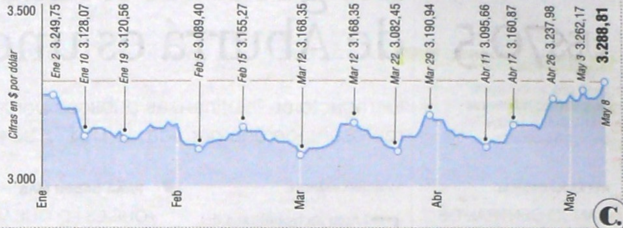
Infografía: EL COLOMBIANO © 2019. RR (N4)