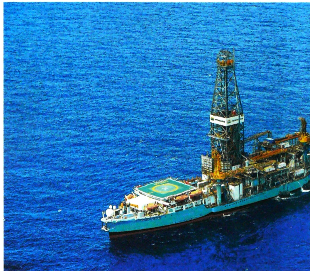
El descubrimiento de gas en aguas profundas del Caribe colombiano requiere inyección nueva de capital.

gistra una producción mundial de 2,9 millones de barriles equivalentes de petróleo por día, además de reservas por 12,1 billones de barriles de petróleo equivalentes, y reporta ingresos de más de US$14.000 millones anuales. “En Colombia, Chevron se ha destacado por su operación de los campos de gas de Chuchupa y Ballenas, en La Guajira; de crudo pesado en Castilla (Meta), y de crudo parafínico en Río Zulia, en el Catatumbo”, explica Espinosa.