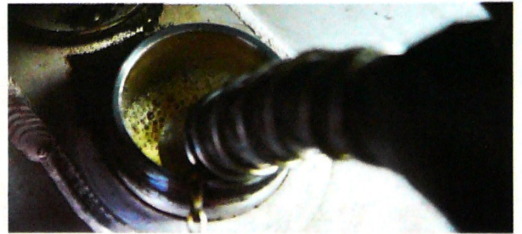
La gasolina se ha encarecido 0,92 % entre enero y marzo.

Los menores impuestos a los combustibles representarán $2 billones de menor recaudo tributario, pero el Gobierno está dispuesto a tolerarlo con tal de salir de los $5 billones que le cuestan los subsidios cada año.