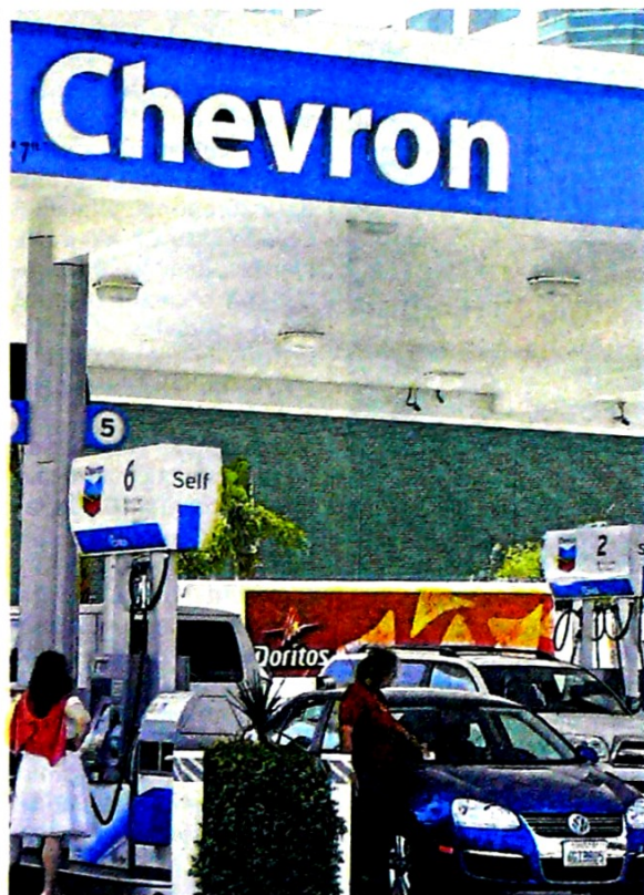
En caso de que Chevron no realice una nueva oferta antes del viernes, recibirá US$1.000 millones de indemnización.

Es por esto que la junta directiva de Anadarko "determinó de manera unánime que la propuesta de adquisición revisada recibida de Occidental Petroleum el 5 de mayo de 2019 constituye una 'Propuesta Superior', según lo definido en el anuncio previo de fusión de Ana-