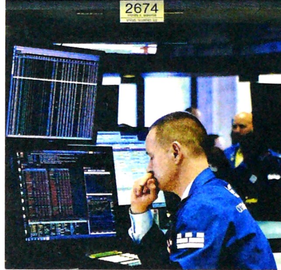
Las bolsas del mundo reportaron descenso ayer.