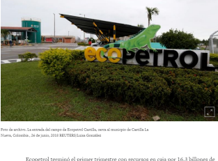
Foto de archivo. La entrada del campo de Ecopetrol Castilla, cerca al municipio de Castilla La Nueva, Colombia, 26 de junio, 2010

Ecopetrol terminó el primer trimestre con recursos en caja por 16,3 billones de pesos y reportó un incremento en su utilidad neta de 5 por ciento en ese periodo a 2,74 billones de pesos (842 millones de dólares)