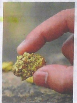
ARCHIVO: EL NUEVO DÍA

"Es necesario fomentar la exploración y la producción en todo el territorio. El sector tiene importantes retos en materia de estabilización y por eso ya se están creando unas expectativas