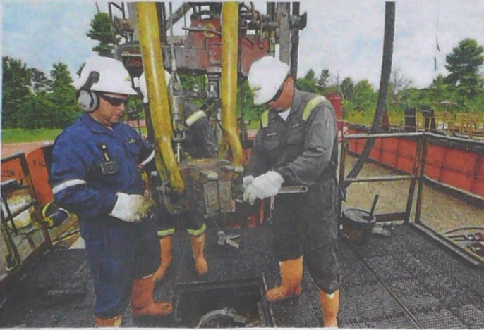
El potencial de los Yacimientos No Convencionales (YNC) en las cuencas del Valle Medio del Magdalena, Cesar, Ranchería y Catatumbo se ha estimado entre 4 y 24 TCF.

De darse la viabilidad para los pilotos de exploración, se deben cumplir ciertas condiciones en la etapa previa, durante la etapa y posterior al proceso para así iniciar la explotación comercial, de ser factible.