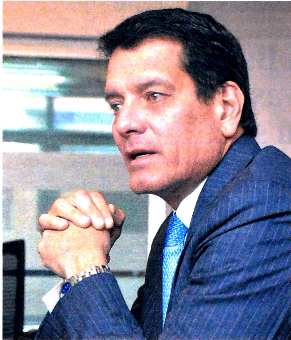
"Ampliaremos la tarea offshore ", Felipe Bayón Pardo, presidente del Grupo Ecopetrol. Ecopetrol

En el plan de negocios de la compañía 2019-2021, señalamos que los hidrocarburos originalmente in situ , en los últimos 12 años, se ha reestimado de 34 a 58 millones de barriles. Se ha duplicado prácticamente el volu-