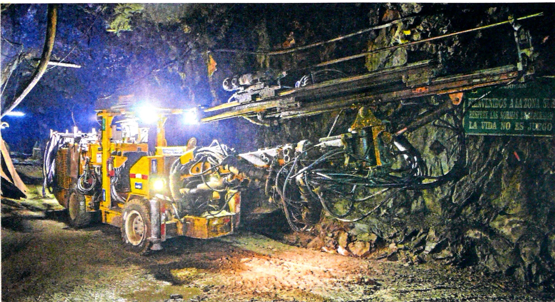
El sistema usa drones autónomos, equipos de cero emisiones, tecnología de banda ultra ancha para minas digitalizadas y lugares de trabajo seguros.