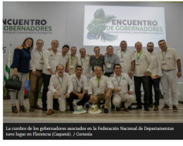
La cumbre de los gobernadores asociados en la Federación Nacional de Departamentos tuvo lugar en Florencia (Caquetá).

Meta, Arauca, Boyacá y Nariño cuestionaron la aprobación de dejar en el PND la puerta abierta a esta práctica extractiva, que tiene una férrea oposición de sectores ambientalistas en el país.