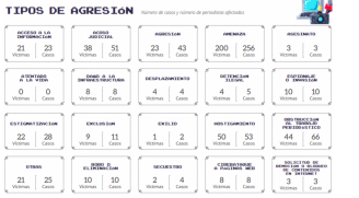
Tipos de agresión según la FLIP. Número de casos y número de periodistas afectados.

Los principales agresores no se tienen identificados por completo. En 180 casos no se sabe quién fue el autor de los hechos. Sin embargo, de los reconocidos, la mayoría se le atribuye a los servidores públicos con 141 agresiones (105 a funcionarios y 36 a fuerza pública).