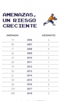
Principales agresores a los periodistas y relación entre amenazas y asesinatos desde 2006 hasta 2018.