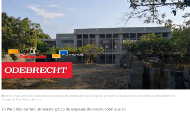
En Perú hizo carrera un selecto grupo de empresas de construcción que en lugar de competir se repartían la torta de contratos del Ministerio de Transporte.

Una lista negra de 17 empresas que se repartían la torta de los contratos viales en Perú está siendo verificada por la Fiscalía de este país. Las coincidencias en Colombia comienzan a despertar la atención de las autoridades. La Contraloría General en Bogotá le sigue la pista a los millonarios en contratos para construcción de aulas.