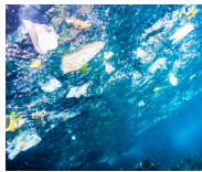
Backing a greener future