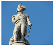
Dividend heroes: companies with dividend increase for 20 years or more