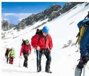
Leading the way