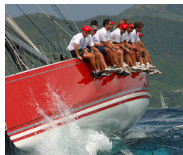
Strong Week to Start 2Q