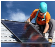
Latin America's Renewable Riches