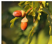
From acorns to oaks