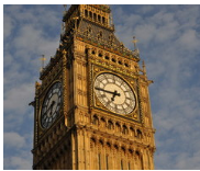
Brexit - UK economic prospects and outlook