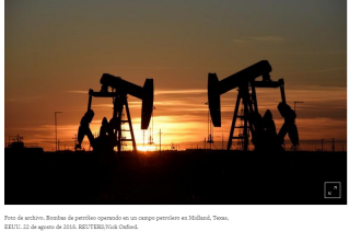
Foto de archivo. Bombas de petróleo operando en un campo petrolero en Midland, Texas, EEUU. 22 de agosto de 2018.

LONDRES, 3 mayo (Reuters) - Los precios del petróleo se encaminaban el viernes a cerrar la semana con una fuerte baja, debido a que un mayor bombeo en Estados Unidos contrarrestó la caída en la producción de Irán y Venezuela.