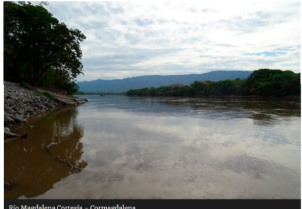
Río Magdalena

La alianza consiste en la asignación de recursos económicos, hasta el año 2022, con los que se realizarán las obras que permitirán la recuperación de la navegabilidad.