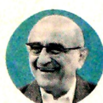
Néstor Humberto Martínez, Fiscal.