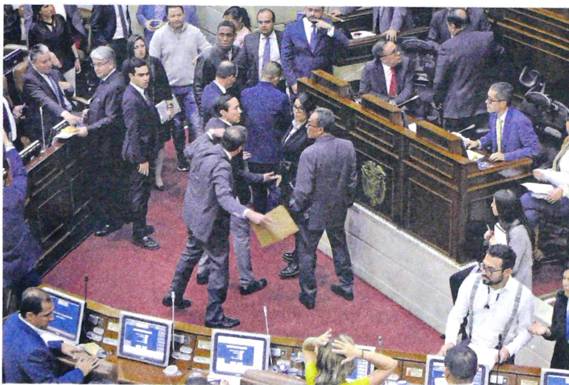
Luego de 50 horas de discusión y tres días continuos, quedó listo el articulado del PND para 4 años.

Se trata de un punto aprobado que cambia la fórmula y reduce los aportes de los operadores de las máquinas tragamonedas. La Cámara aprobó el proyecto del Plan Nacional de Desarrollo, y al cierre de esta edición, el Senado evaluaba la opción de acoger el texto avalado por los representantes. Pág. 8