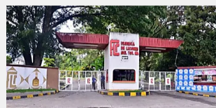
Indegan a funcionarios de la Fábrica de Licores del Tollma