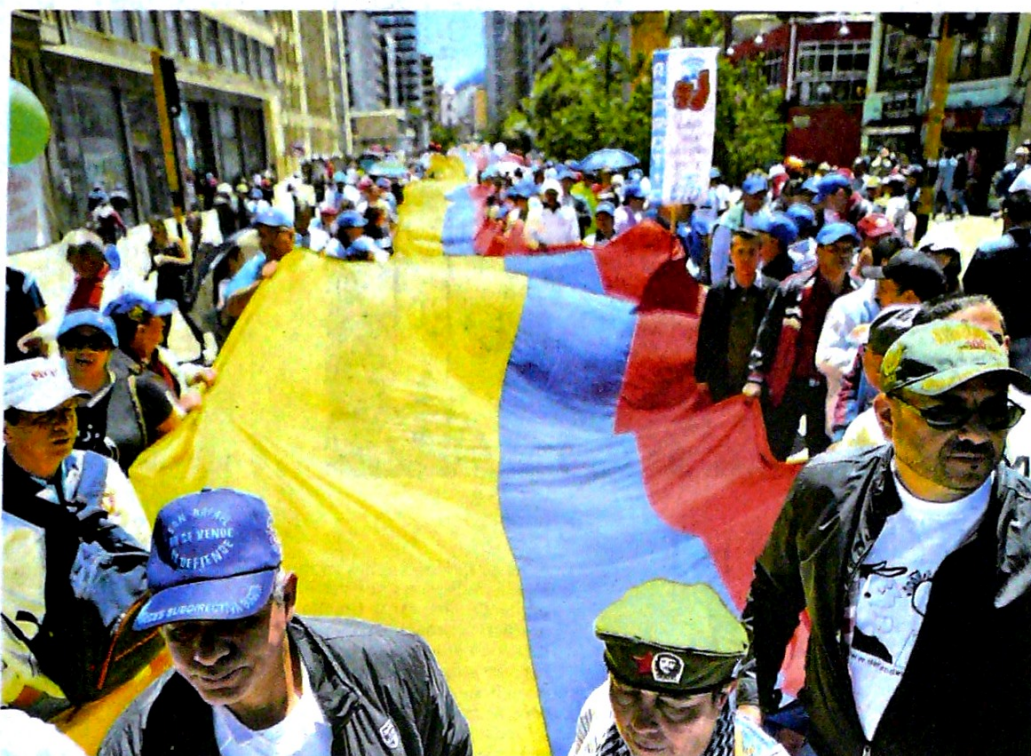
El país vivió en paz la jornada del primero de mayo. Las marchas se desarrollaron sin incidentes en las principales ciudades del país, como Bogotá, Cali y Bucaramanga. Por primera vez en varios años, en Bogotá no fue necesario desplegar el Escuadrón Móvil Antidisturbios (Esmad) para controlar desmanes. Solo Medellín y Barranquilla vieron algunos disturbios. Colombia / 1.14