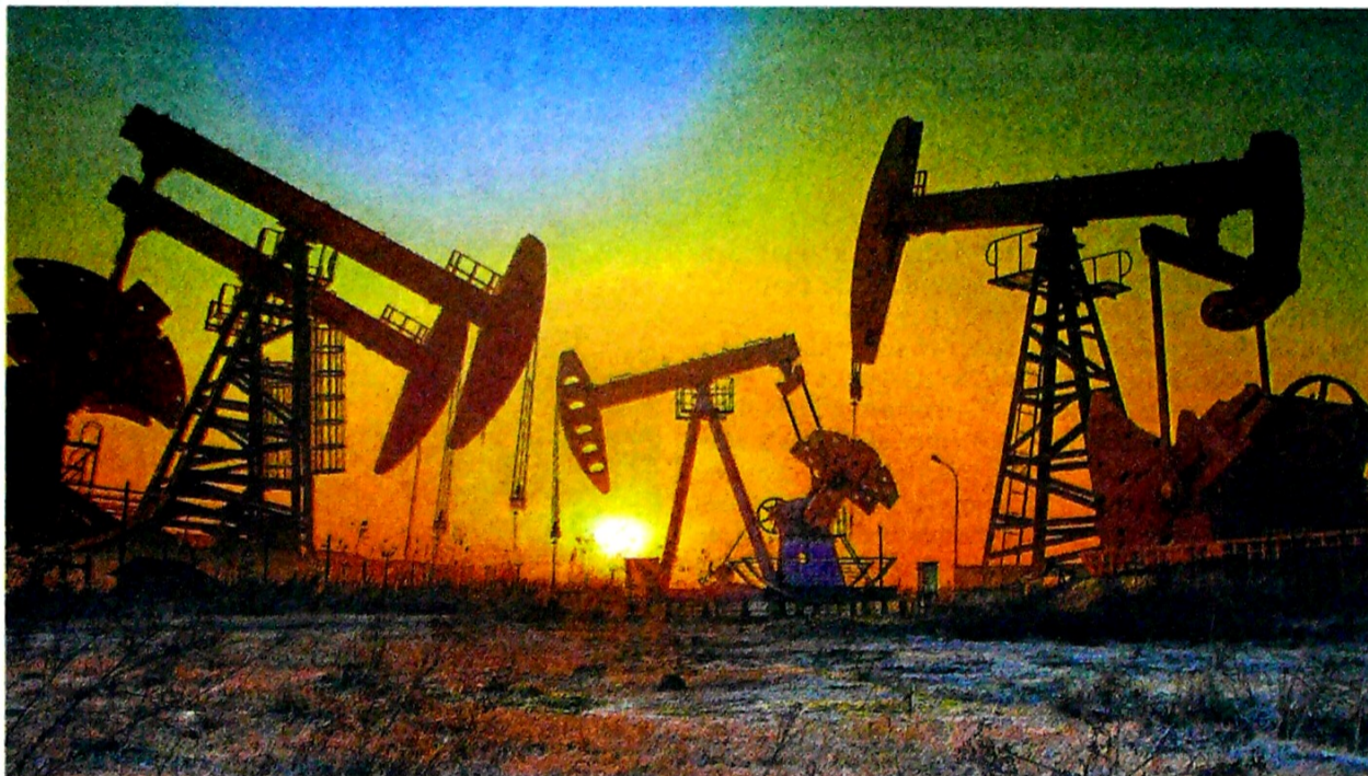
El promedio del precio global del barril de crudo en el 2018 (US$72,01) ayudó a incrementar el nivel de reservas en el país.

“Colombia cuenta con reservas de crudo para 5,7 años, y de gas para 11,7 años, lo que hace necesario una redinamización de la operación petrolera”.