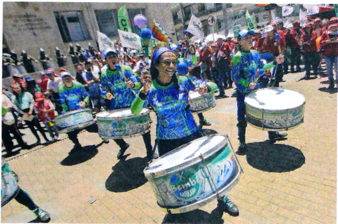
Autoridades de la capital destacaron el buen comportamiento de los asistentes a las marchas.

La decisión, proferida por el Tribunal Administrativo de Cundinamarca, cobija a más de cuatro millones de usuarios del régimen contributivo y del subsidiado. El fallo judicial ordenó, además, anular la compra de Cafesalud y Esimed. Pág. 13