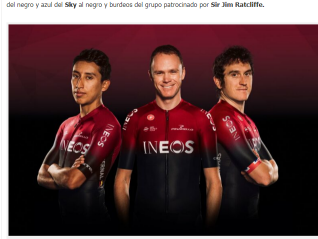
Bernal, Froome y Thomas

El Ineos británico ha desvelado su nueva ropa que estrenan este 2 de mayo en la primera etapa del Tour de Yorkshire . Egan Bernal, Chris Froome y Geraint Thomas han servido de modelos pasando del negro y azul del Sky al negro y burdeos del grupo patrocinado por Sir Jim Ratcliffe.