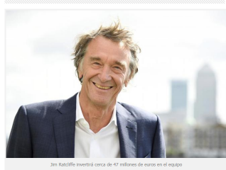
Jim Ratcliffe invertirá cerca de 47 millones de euros en el equipo

Sir Dave Brailsford , director del equipo. "El anuncio es una gran noticia para el equipo, para los aficionados del ciclismo y para el deporte en general. Termina la incertidumbre alrededor del equipo y la velocidad con la que ha pasado representa un gran voto de confianza en nuestro futuro. Sé que hemos encontrado al socio adecuado cuya visión, pasión y espíritu pionero pueden llevarnos a un éxito aún mayor dentro y fuera de la bicicleta. Anuncia el inicio de un nuevo capítulo muy emocionante para todos nosotros como Equipo INEOS. Me gustaría agradecer personalmente a Jeremy Darroch, CEO de Sky Group, quien hace más de una década tuvo la visión de respaldarnos cuando otros pensaban que estábamos locos. Su apoyo al equipo a través de la fuerza y la dureza ha sido notable y todos en Team Sky le agradecen por todo lo que ha hecho por nuestro deporte".