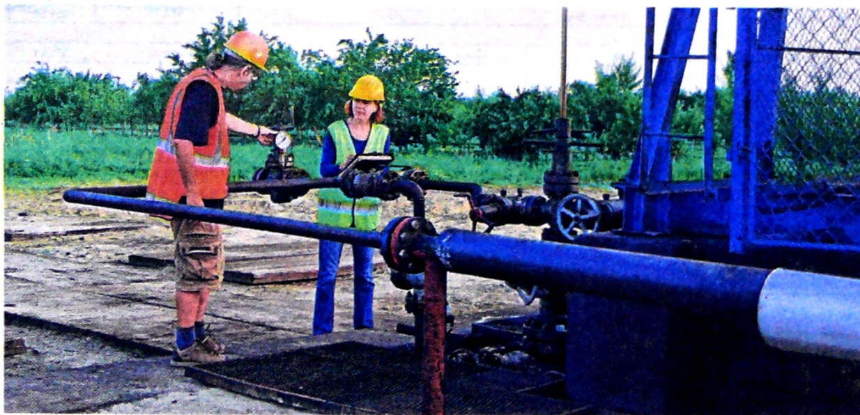
La ronda ofertará bloques con prospectividad para producir entre 1.500 y 3.000 barriles diarios de petróleo.

los técnicos consultados, quien subrayó que “se procurará llegar a unos términos donde se pueda conciliar lo que más pueda beneficiar al Estado”.