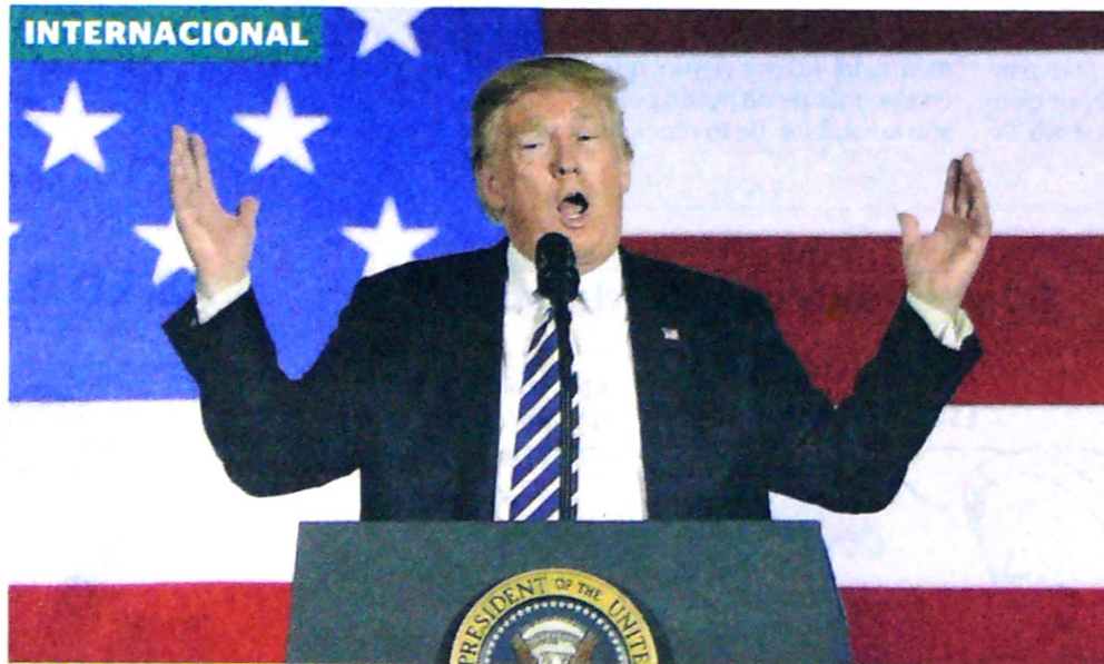
Hoy, en la Florida, Donald Trump lanza su campaña de reelección para los comicios del 2020.