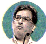
ALBERTO CARRASQUILLA Ministro de Hacienda

En parte, en este recuadro solo se menciona la posibilidad de extraer crudo y gas vía la fracturación hidráulica, aunque enfatiza que podrá hacerse "siempre y cuando se realice de acuerdo a la normatividad vigente y se dé una ejecución responsable de la actividad, que permita anticipar y mitigar posibles externalidades negativas", según detalla el Mfmp.