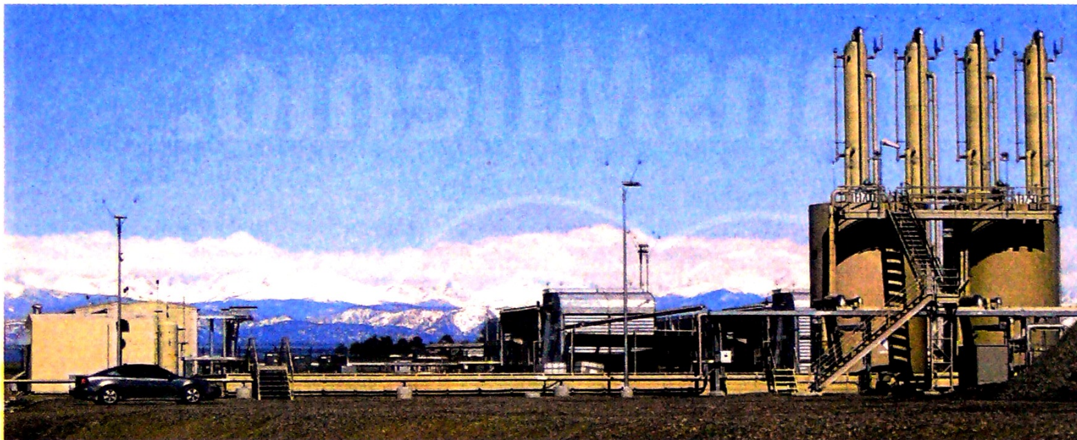
Según el Minhacienda, el 'fracking' le daría a Colombia reservas de petróleo por 7.500 millones de barriles, es decir, casi 24 años adicionales.