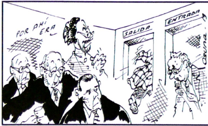
La Corte soltó a Santrich y entró a Uribe