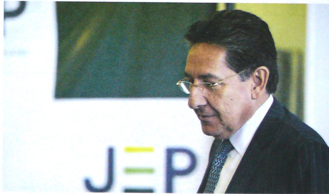
El exfiscal general Néstor Humberto Martínez.