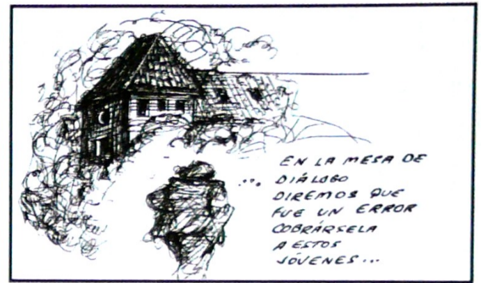
Guerrilla mató a jóvenes policías