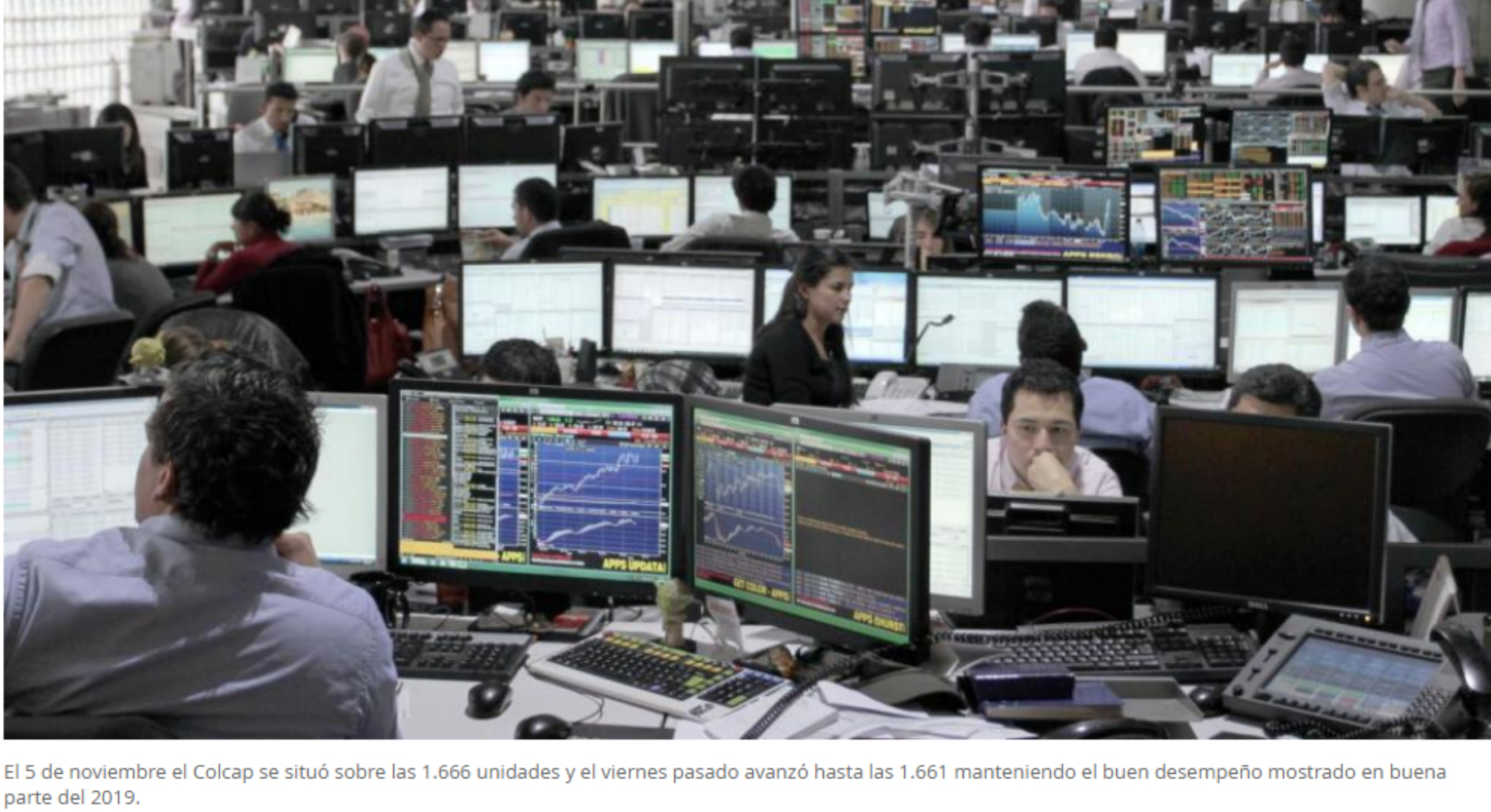
El 5 de noviembre el Colcap se situó sobre las 1.666 unidades y el viernes pasado avanzó hasta las 1.661 manteniendo el buen desempeño mostrado en buena parte del 2019.

RELACIONADOS: BANCOS EN COLOMBIA | BOLSA DE VALORES DE COLOMBIA | ACCIONES EN LA BOLSA