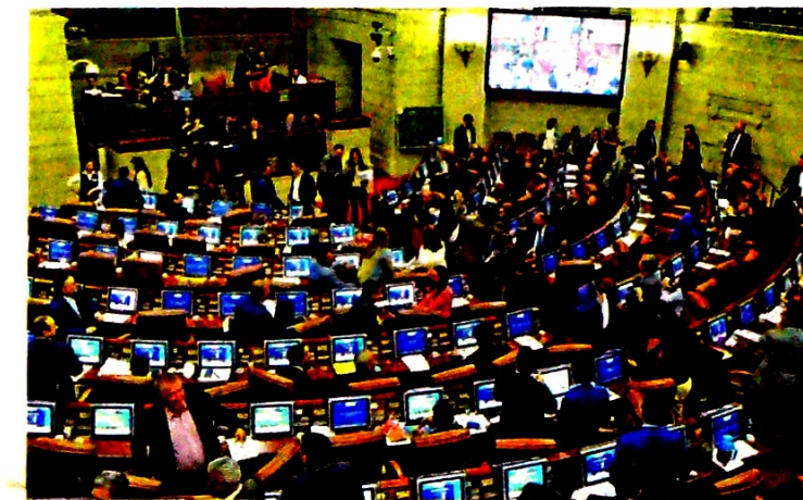
Para marzo está previsto que se le dé el tercer debate a la iniciativa.

de medio salario al año pagadero en dos partidas, una en el primer semestre (30 de marzo) y otra en el segundo (30 de septiembre).