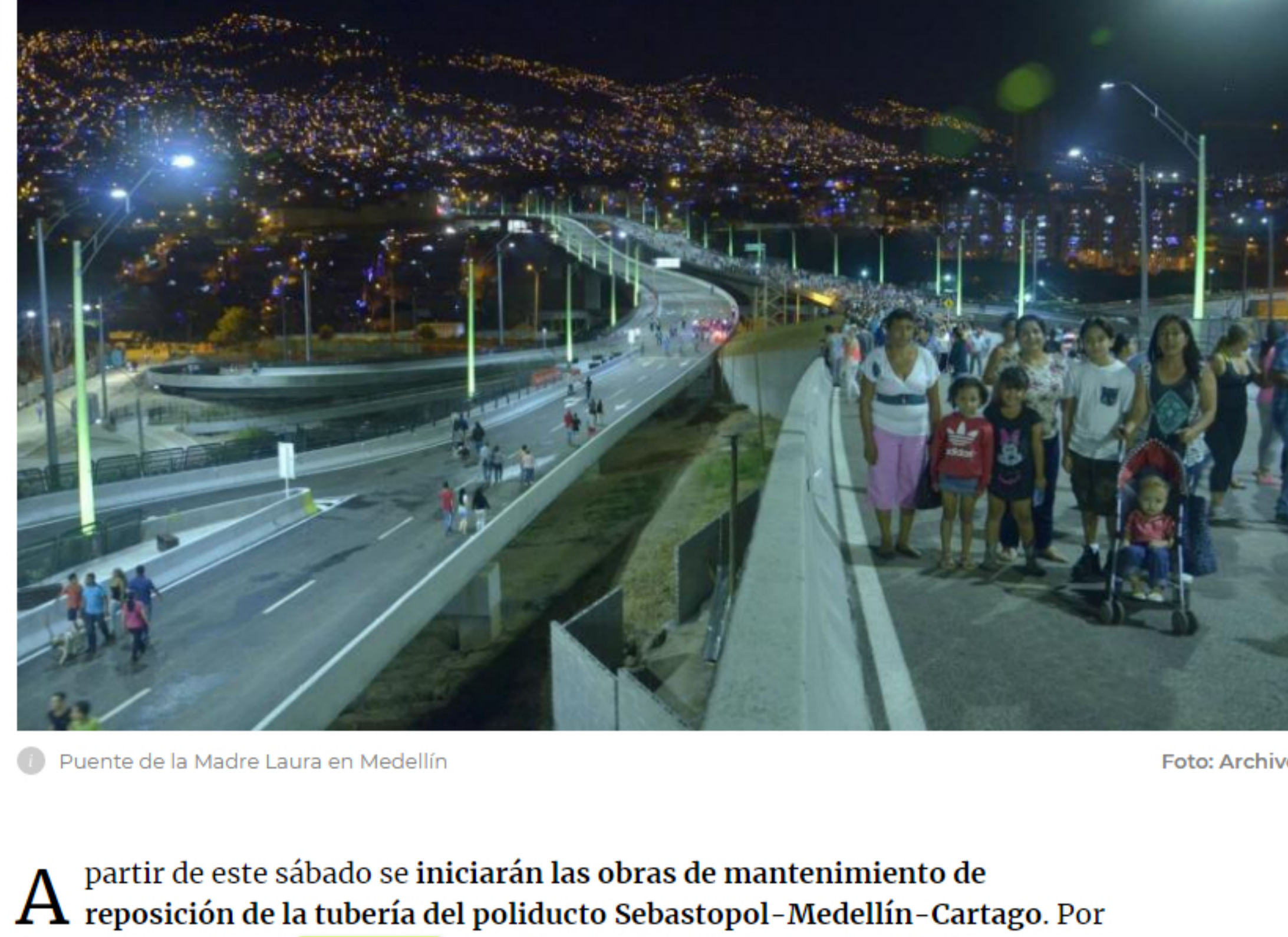
Puente de la Madre Laura en Medellín