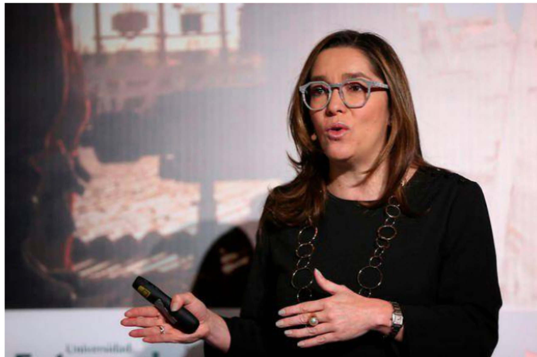
Así es el proyecto de decreto que definirá los pilotos para fracking en Colombia

Empresas como Ecopetrol están a la espera de esta reglamentación del Gobierno para iniciar las investigaciones.