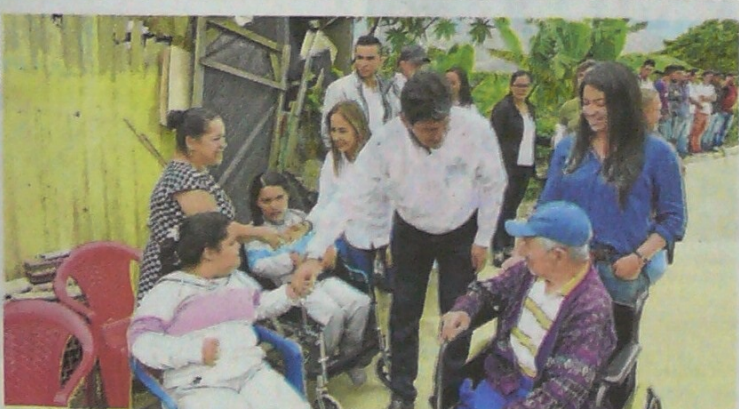
LA CONSTRUCCIÓN de la vía generó 32 puestos de trabajo de mano de obra local, en su mayoría de los barrios beneficiados.

Reducción en la tarifa regirá a partir del primero de enero de 2020.