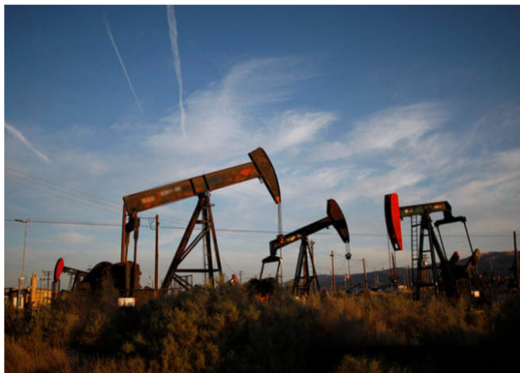
BLU Radio. Fracking // Foto: AFP, imagen de referencia

El debate llegará a la conversación nacional el próximo 16 de enero; el Gobierno espera que los ambientalistas comenten la propuesta. Aunque el fracking está suspenso por el Consejo de Estado, hay vía libre para los proyectos piloto de investigación que podría adelantar Ecopetrol y otras empresas en 2020.