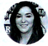
María Fernanda Suárez Ministra de Minas y Energía

38% fue la tasa de éxito de adjudicación