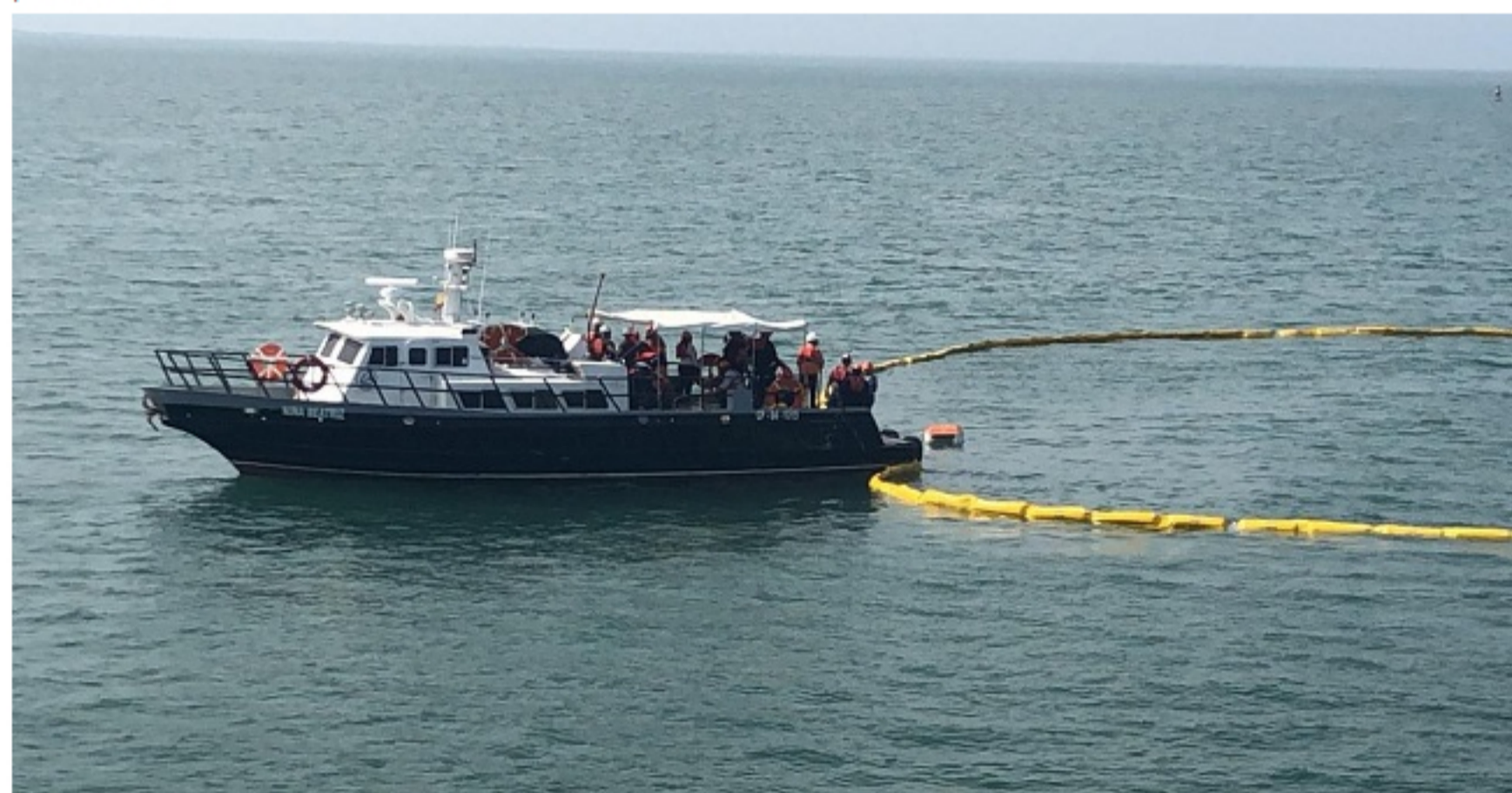
El ejercicio liderado por Dimar a través de su Capitanía de Puerto, contó con la participación de los terminales portuarios de Puerto Nuevo, Drummond Ltd., Ecopetrol S.A. y Sociedad Portuaria de Santa Marta.

El ejercicio liderado por Dimar a través de su Capitanía de Puerto, contó con la participación de los terminales portuarios de Puerto Nuevo, Drummond Ltd., Ecopetrol S.A. y Sociedad Portuaria de Santa Marta, conformando un centro de operaciones de emergencia en Puerto Nuevo en el que se interactuó con otras entidades como: Marítimos Arboleda, Terlica, Corpamag, Bomberos de Ciénega, Oficina de Gestión del Riesgo de Desastres Departamental, Invemar, Autoridad de Licencias Ambientales - Anla, Aunap, Oficina Ambiental de la Alcaldía de Ciénega y representantes de las comunidades pesqueras de las zonas de influencia de la zona portuaria.