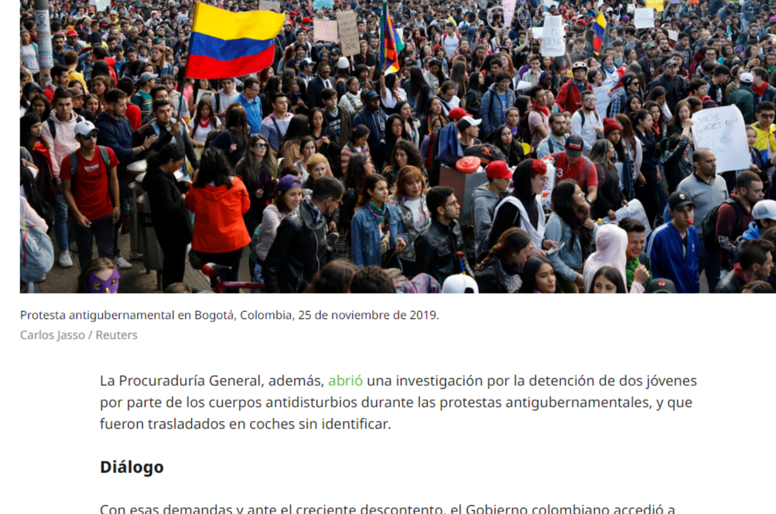
Protesta antigubernamental en Bogotá, Colombia, 25 de noviembre de 2019.