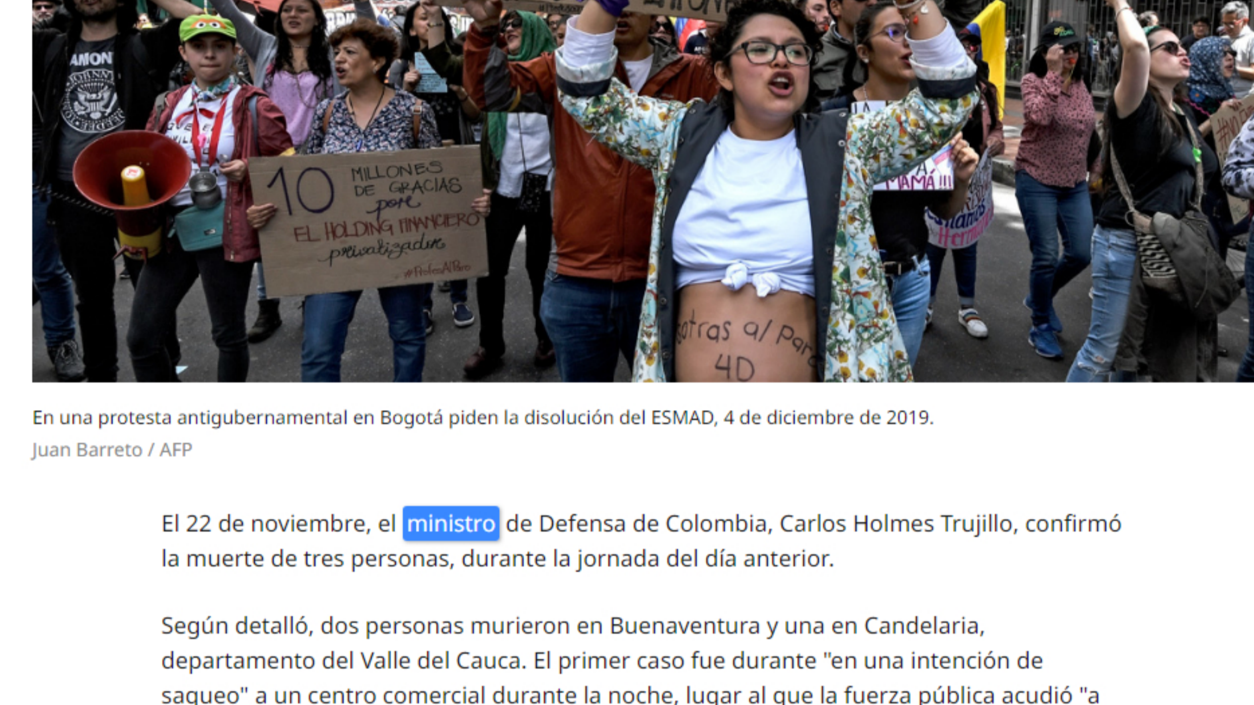
En una protesta antigubernamental en Bogotá piden la disolución del ESMAD, 4 de diciembre de 2019.

Estas manifestaciones han estado caracterizadas por reiteradas denuncias de uso excesivo de la fuerza por parte de la policía.