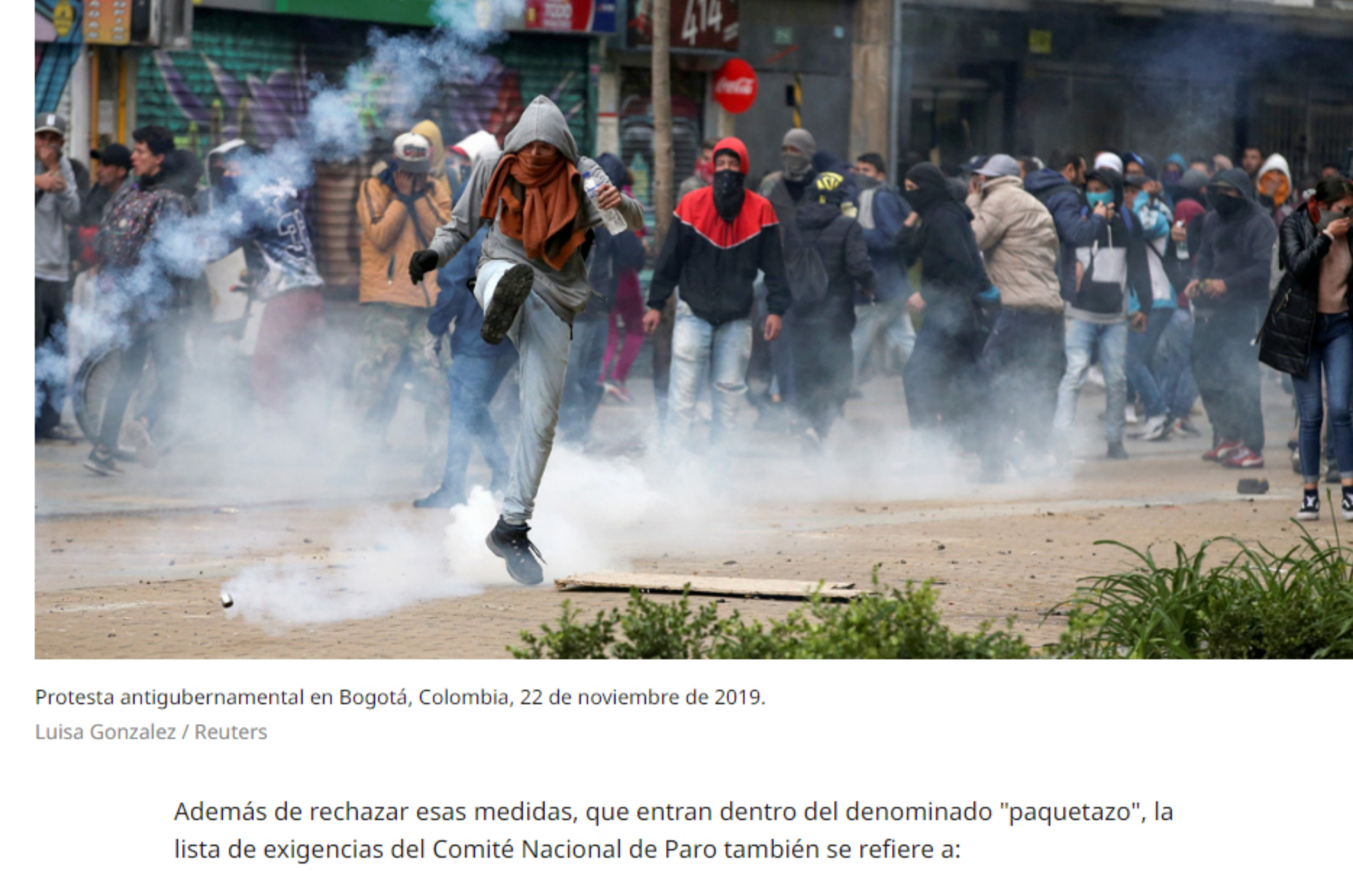
Protesta antigubernamental en Bogotá, Colombia, 22 de noviembre de 2019.

Además de rechazar esas medidas, que entran dentro del denominado "paquetazo", la lista de exigencias del Comité Nacional de Paro también se refiere a: