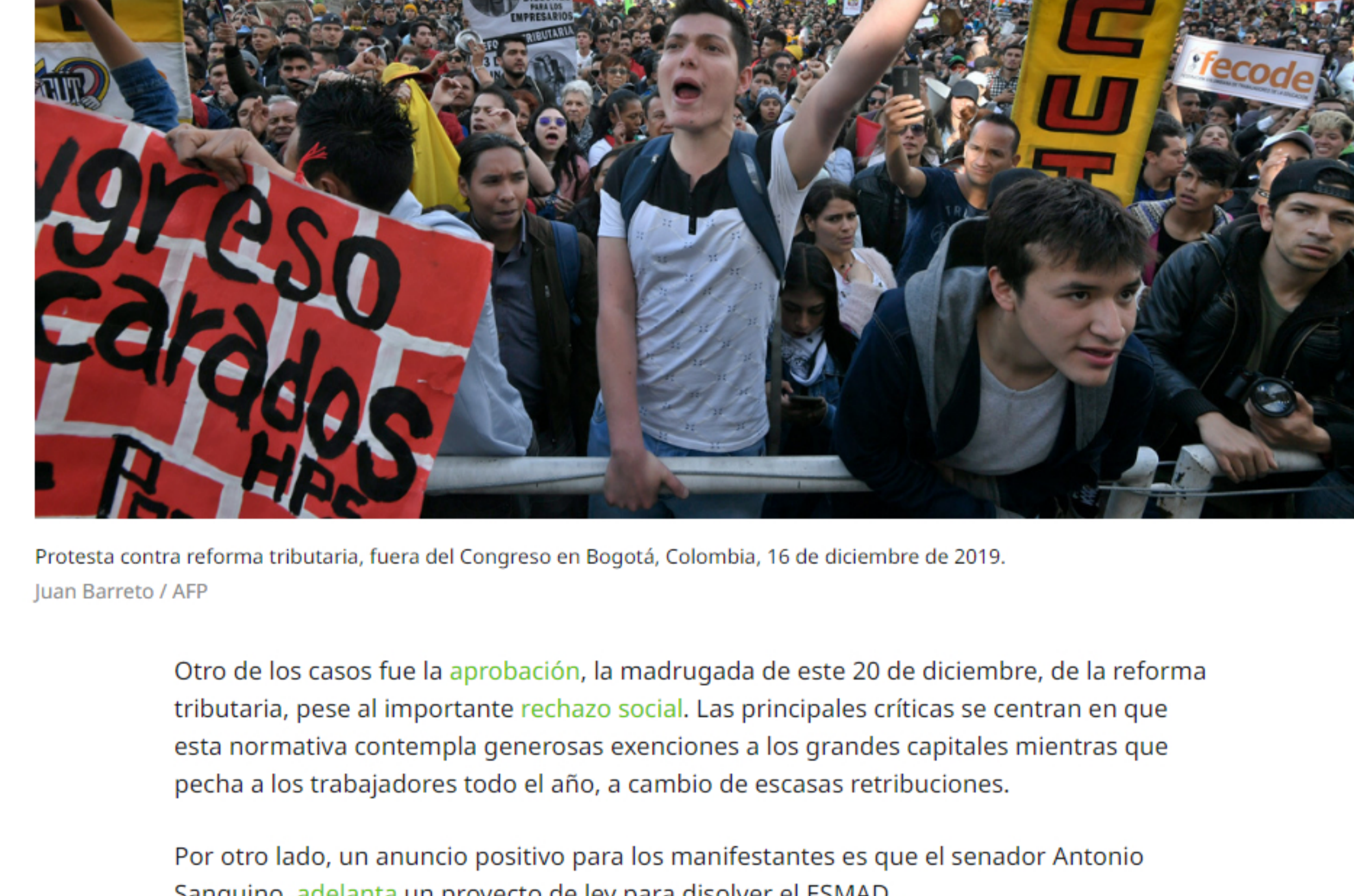
Protesta contra reforma tributaria, fuera del Congreso en Bogotá, Colombia, 16 de diciembre de 2019.

Por ejemplo, el 25 de noviembre, mediante el Decreto 211 de 2019, el Gobierno materilizó la creación del holding financiero estatal , al que le dio por nombre Grupo Bicentenario.