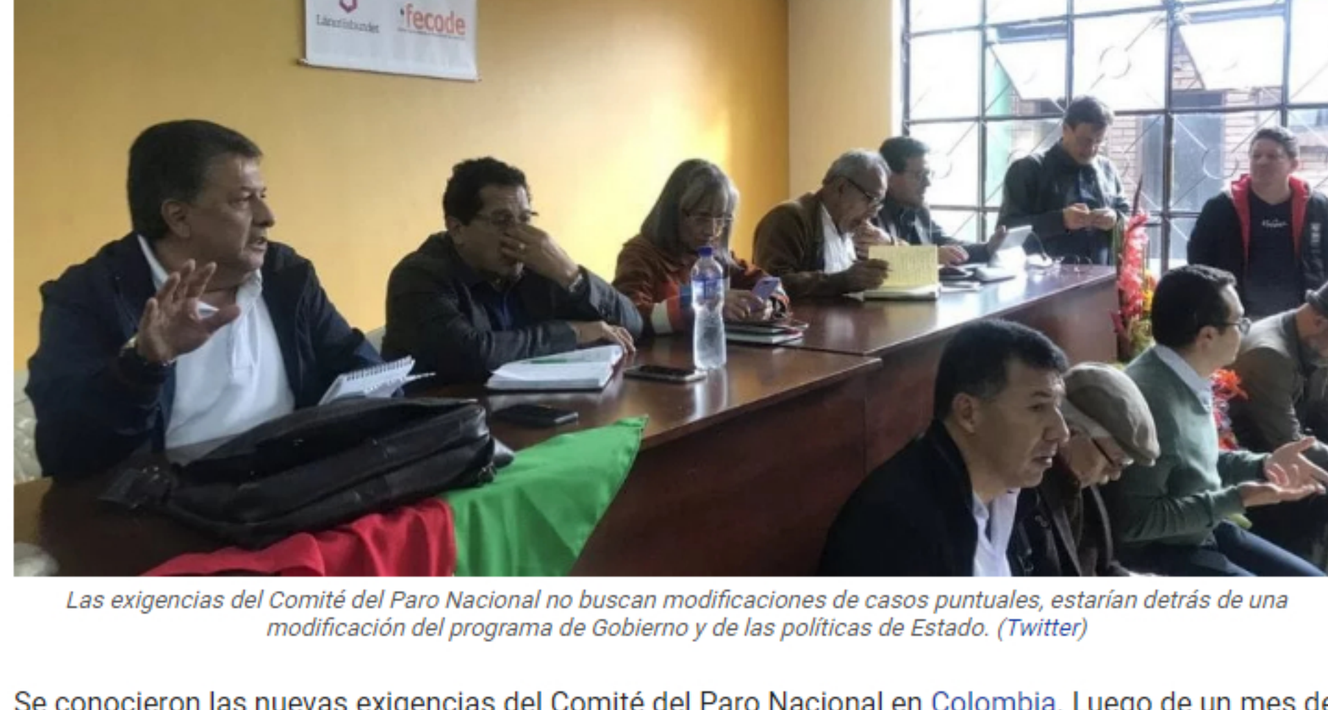
Las exigencias del Comité del Paro Nacional no buscan modificaciones de casos puntuales, estarían detrás de una modificación del programa de Gobierno y de las políticas de Estado.

Se conocieron las nuevas exigencias del Comité del Paro Nacional en Colombia. Luego de un mes de movilizaciones en las calles, de manera sorpresiva pasaron de un pliego de 13 puntos a uno de 104.