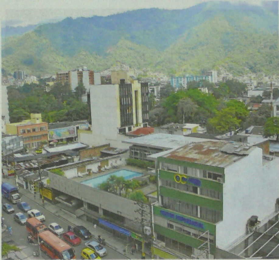
El valor de los créditos aprobados entre julio y septiembre de 2019 por Finagro para el financiamiento del sector agropecuario en la región centro ascendió a $288 mil millones.

Y el área autorizada para construir en la región centro se redujo en 2,5% frente