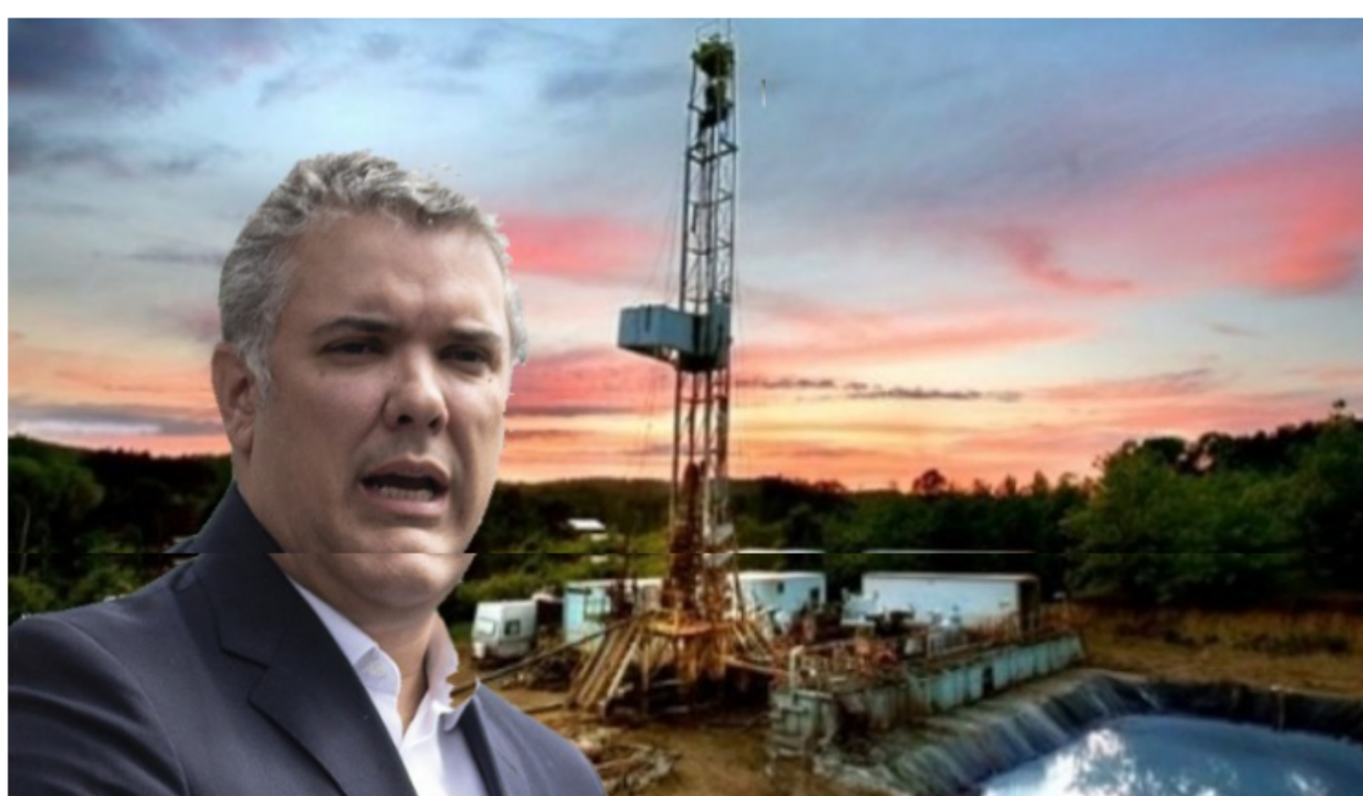
Mientras el poder judicial da ejemplo, el gobierno nos hace creer que podemos pasarle de agache a la ciencia y andar tan campantes pensando en hacer fracking

Este es un espacio de expresión libre e independiente que refleja exclusivamente los puntos de vista de los autores y no compromete el pensamiento ni la opinión de Las2Orillas.