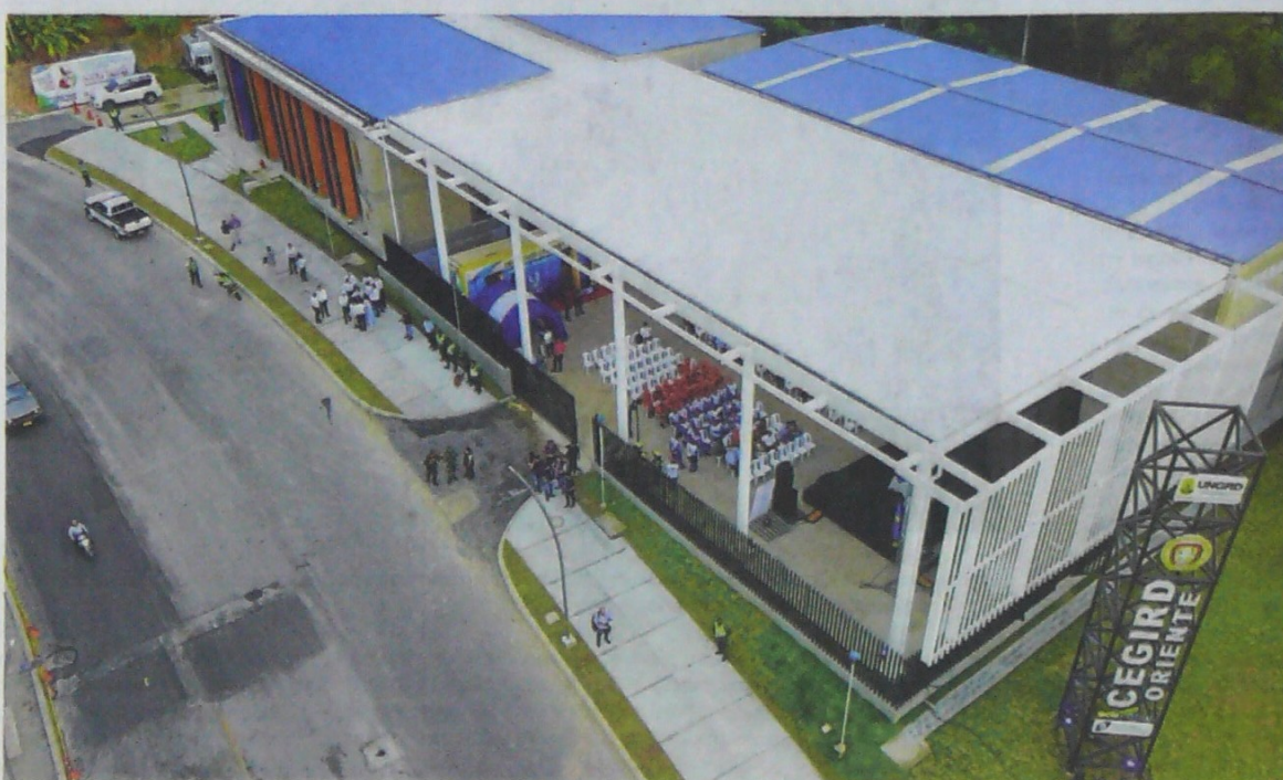
Miguel Vergel / VANGUARDIA

y el acceso vehicular a parqueaderos externos. Allí está contenida la mayor parte del proyecto ubicando en el primer piso servicios para el público como auditorio y cafetería; en el segundo piso se desarrollan todas las oficinas y demás ambientes privados.