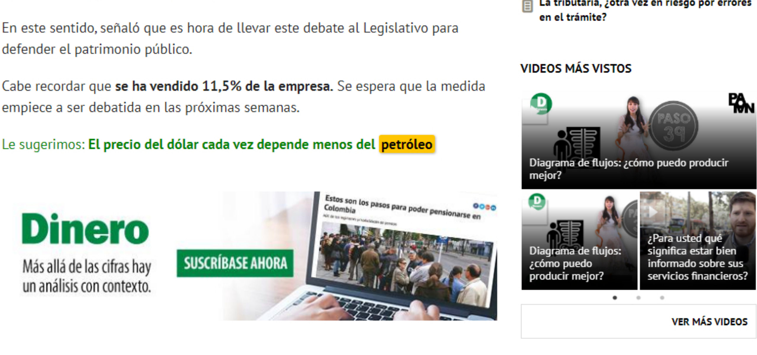
Hasta el momento se ha vendido 11,5% de la empresa.

En el Congreso de la República se radicó un proyecto de ley que busca prohibir la venta del 8,5% de las acciones de la petrolera estatal.