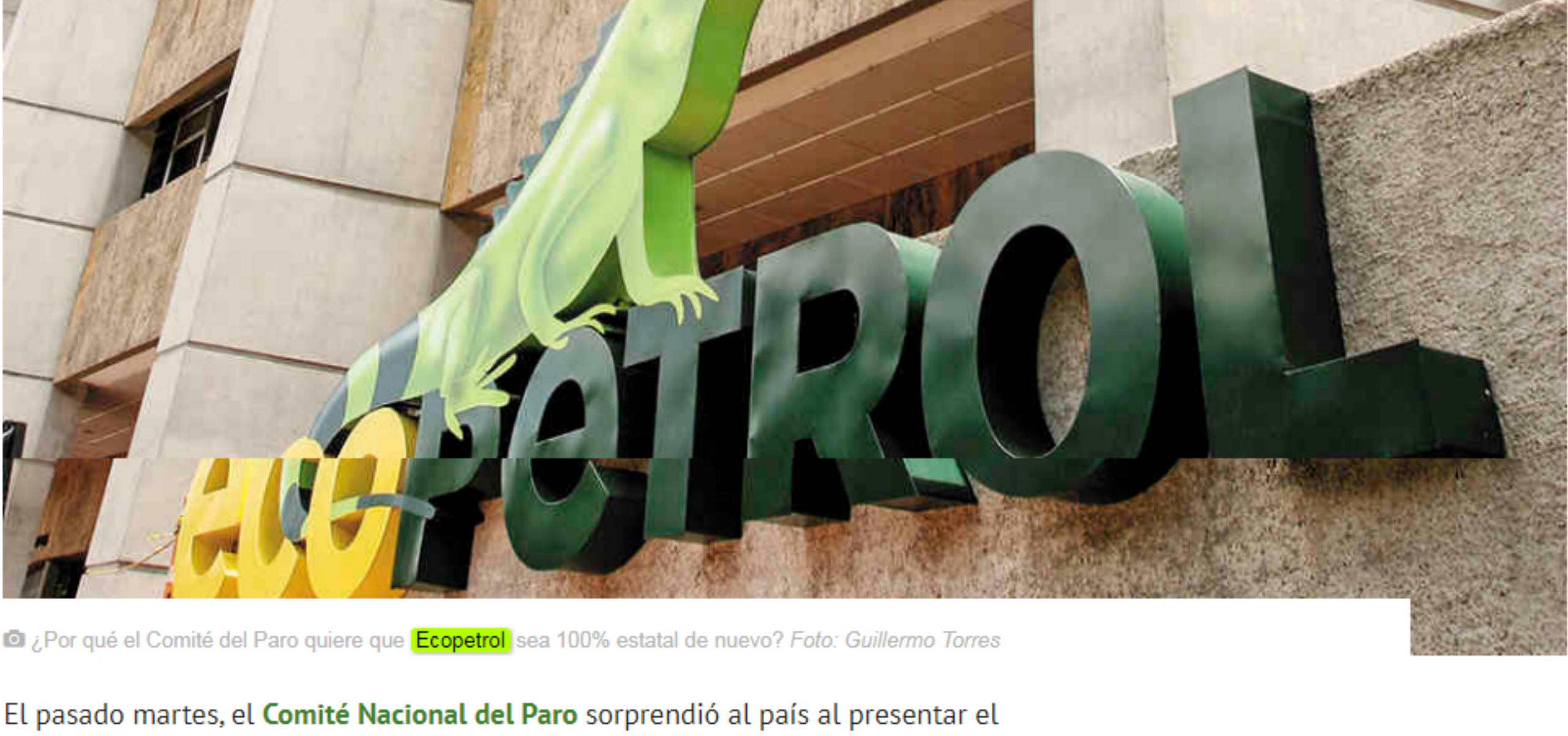
¿Por qué el Comité del Paro quiere que Ecopetrol sea 100% estatal de nuevo?

En el pliego de peticiones presentado esta semana, el comité hizo esta petición al Gobierno Nacional. La pregunta es qué tanto le conviene a la compañía esta decisión.