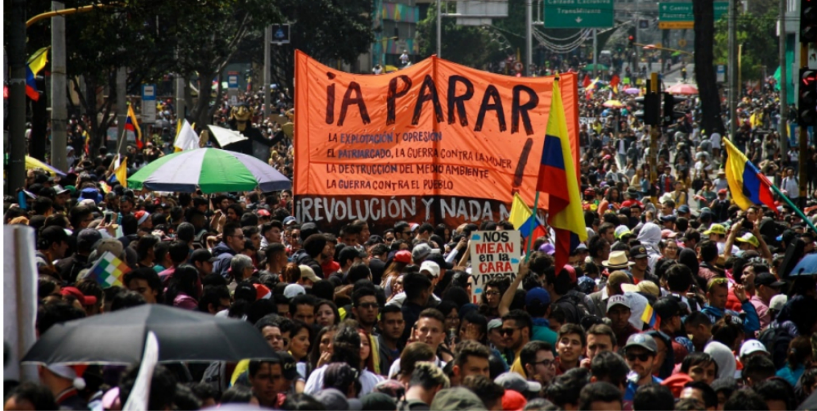
Marcha del paro nacional el 8 de diciembre