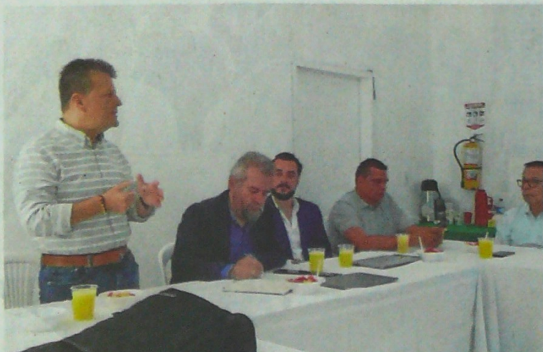
PRONORCO, ASOCARBONOR E INDURCILLA, con el apoyo del representante a la Cámara, Jairo Cristo, estructuraron la propuesta con la que esperan que el Gobierno Nacional los incluya dentro del régimen de las ZESE.

"Sería conveniente para el Gobierno que entraran los