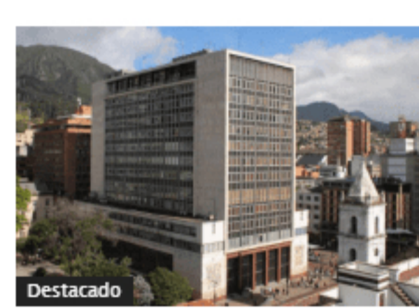
A noviembre, inversión extranjera directa en Colombia creció 20,62 %