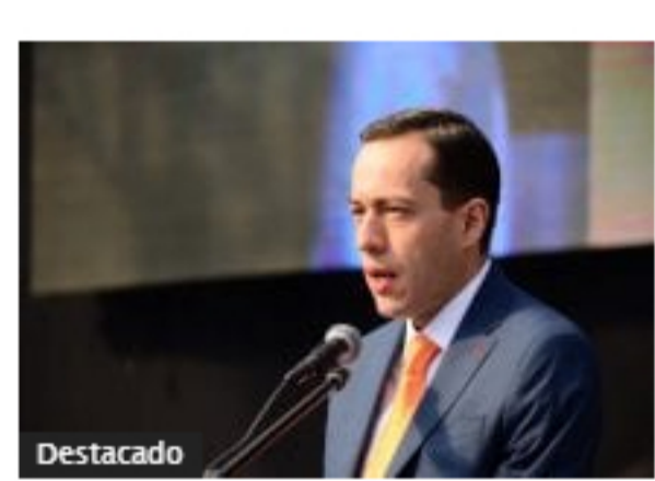
Superindustria decidirá tres importantes investigaciones a comienzos de 2020, entre ellas Ruta del Sol II