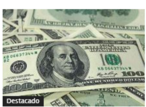
Dólar ha perdido $160 desde máximos de noviembre