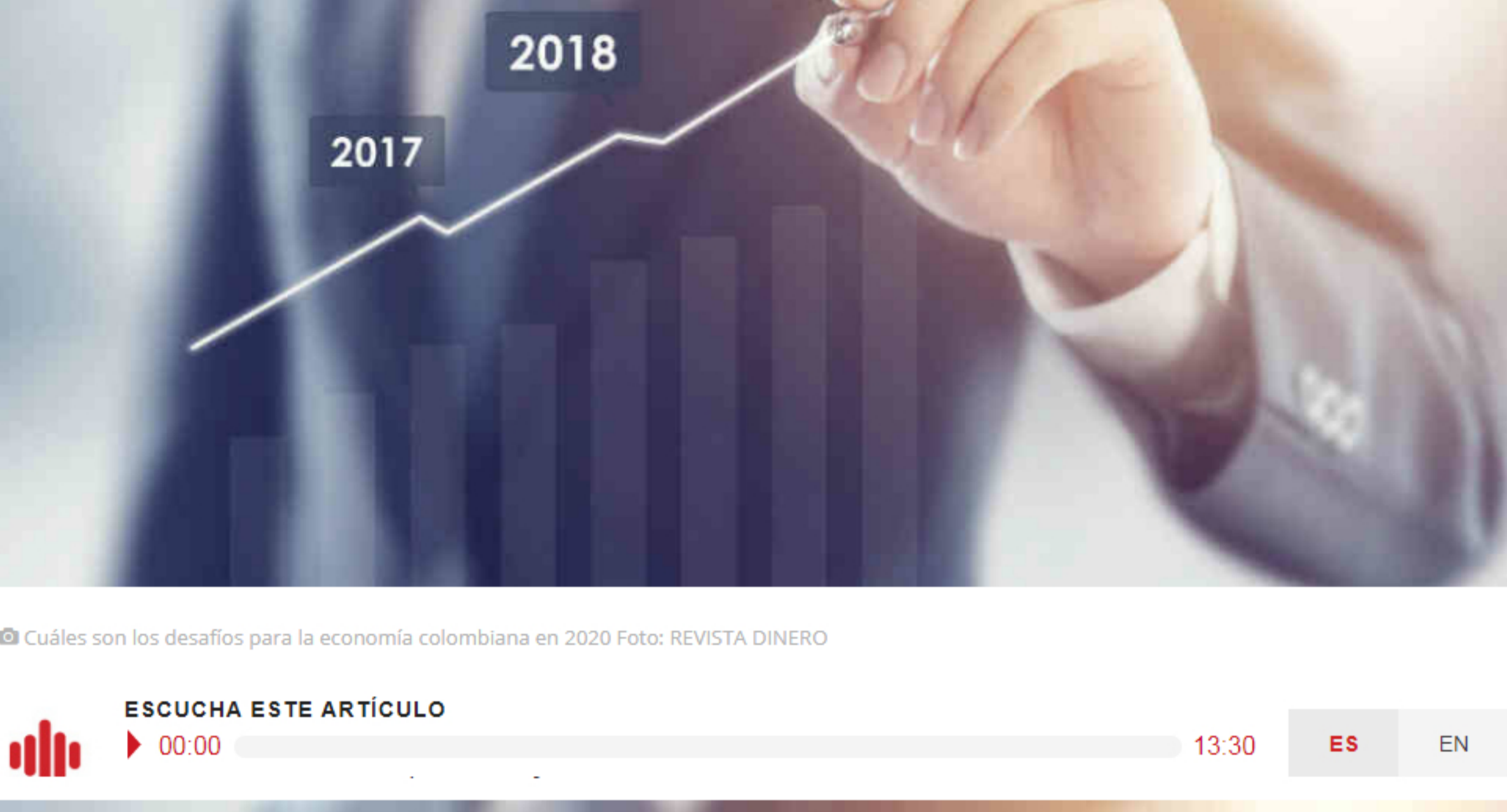
© Cuáles son los desafíos para la economía colombiana en 2020 Foto: REVISTA DINERO

La economía colombiana seguirá creciendo por encima del resto de la región. Sin embargo, lo hará de manera insuficiente para solucionar los problemas sociales. El país requiere reformas de fondo para crecer de modo inclusivo, equitativo y sostenible.