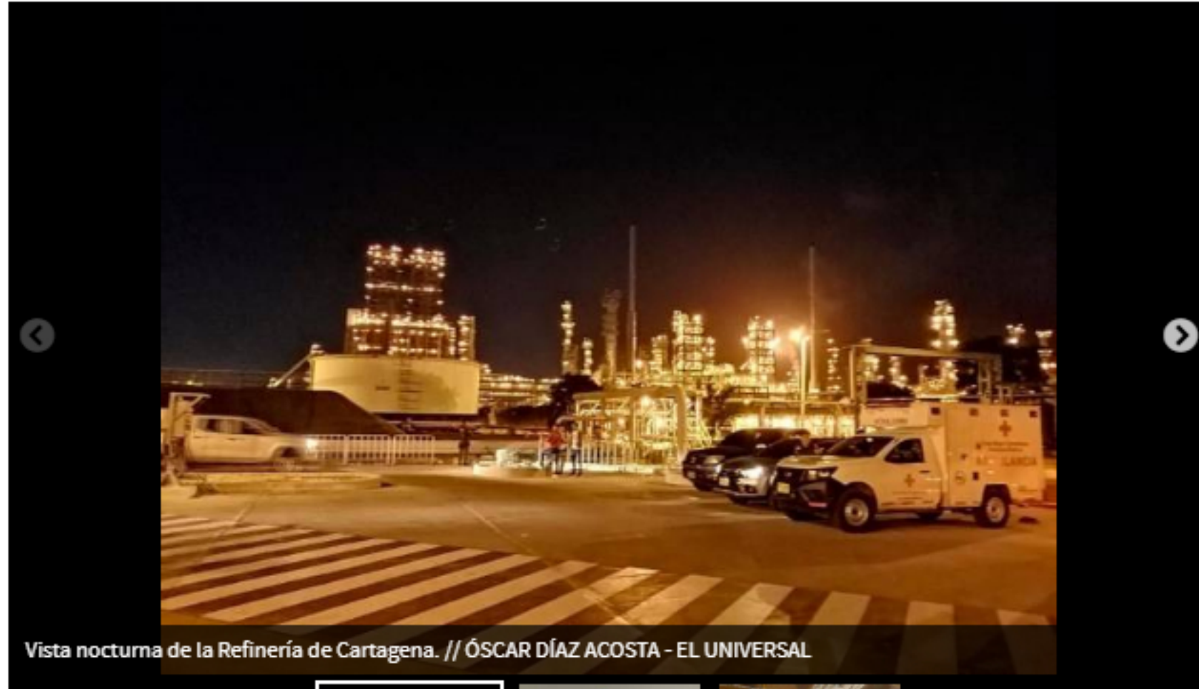
Vista nocturna de la Refinería de Cartagena.

EL UNIVERSAL | @EiUniversalCtg | HERMES FIGUEROA ALCÁZAR | @EiUniversalCtg | 14 de diciembre de 2019 12:00 AM |