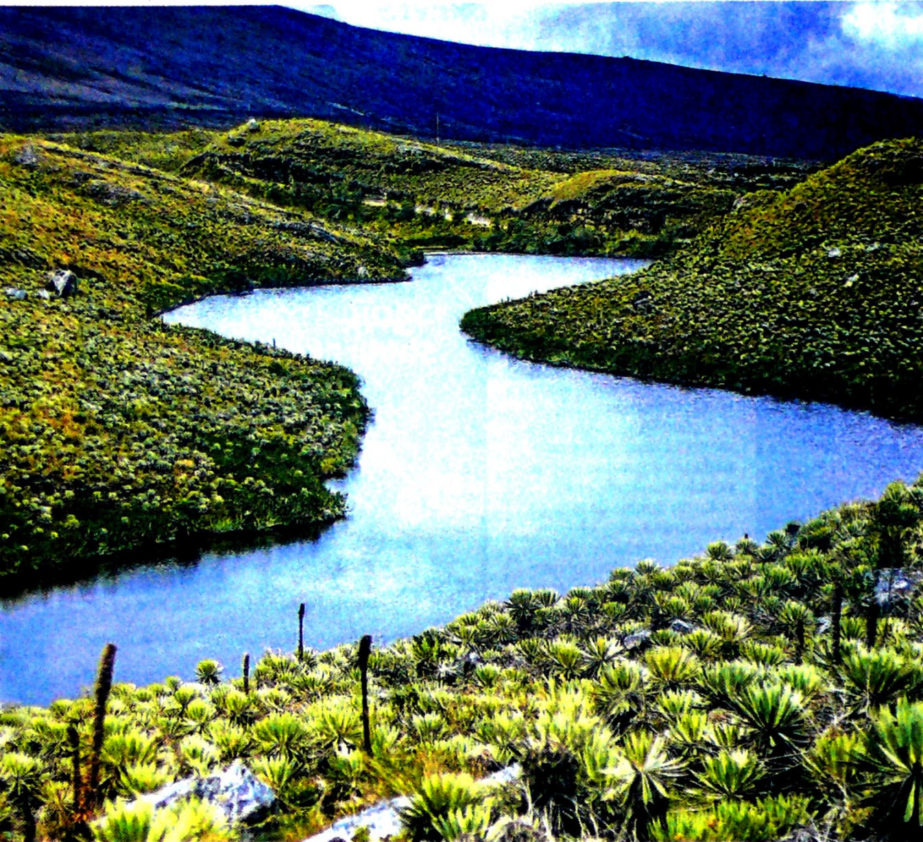
EAAB recibió premio con el proyecto de servicios ecosistémicos, Páramos de Guerrero, Chingaza, Sumapaz y cerros de Bogotá.