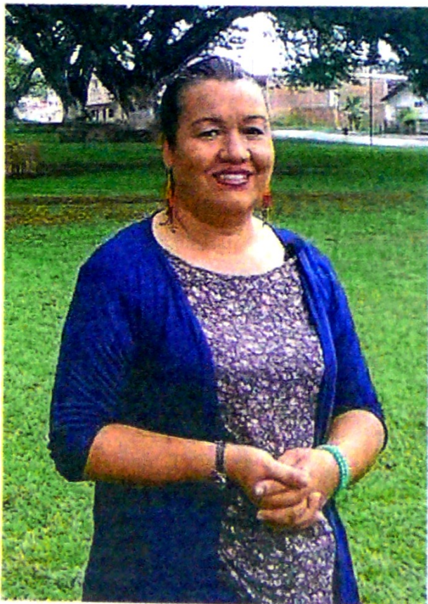
Los embarazos en mujeres adolescentes cayeron 1,6%.

Esta tarea se concretó gracias a la articulación de la administración departamental con organizaciones locales para el desarrollo del proyecto, junto con actores públicos y academia, que, en conjunto, beneficiaron a 145.000 personas.